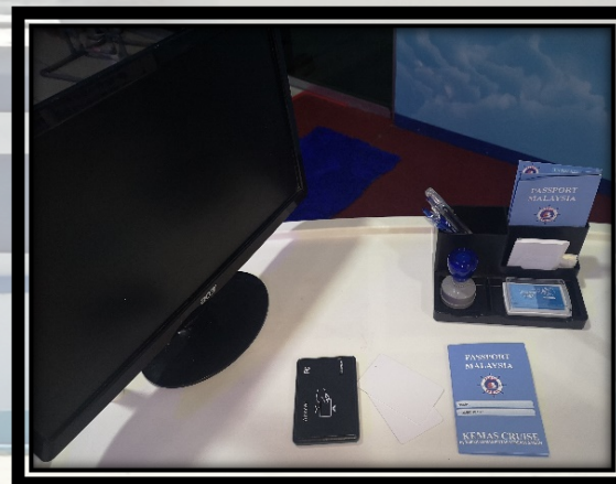
PASSPORT, KAD AKSES & MONITOR